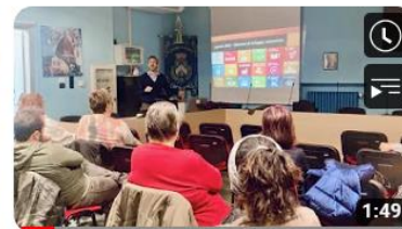
Regione 4.7 ad Almese