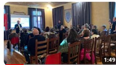
Regione 4.7 a Gaiola