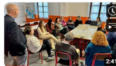
Progetto Regione 4.7 - Educazione alla cittadinanza globale