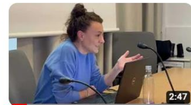
Regione 4.7 a Carmagnola