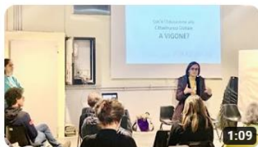
Regione 4.7 a Vigone

Video: https://www.youtube.com/@ancipiemonte/videos