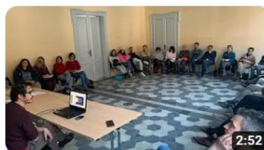
Progetto Regione 4.7 - Educazione alla cittadinanza globale - Valdiliana