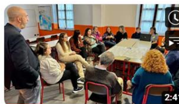
Progetto Regione 4.7 - Educazione alla cittadinanza globale