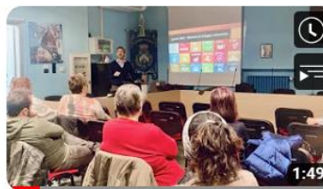
Regione 4.7 ad Almeze