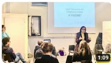
Regione 4.7 a Vigone

Video: https://www.youtube.com/@ancipiemonte/videos