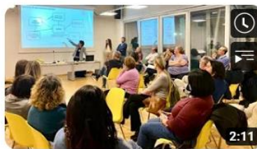
Regione 4.7 a Rifreddo