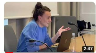
Regione 4.7 a Carmagnola