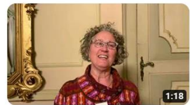
Regione 4.7 a Borgomanero