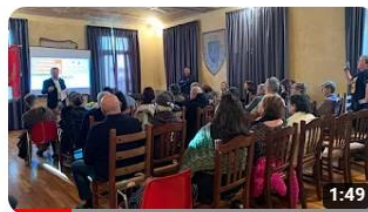
Regione 4.7 a Gaiola